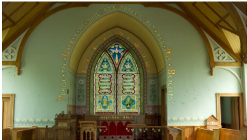
Réalisation du film Les couleurs de l'âme MRC du Haut-Saint-Laurent (Montérégie)