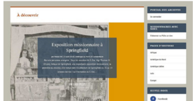
Centre virtuel de la mémoire historique missionnaire Sœurs missionnaires de l'Immaculée-Conception (Laval)