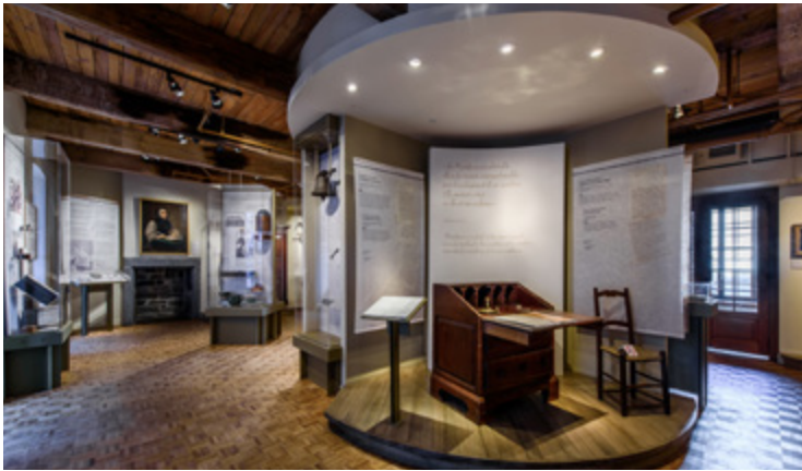
Visite virtuelle de l'exposition Marcher dans ses pas Sœurs grises de Montréal (Montréal)