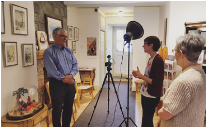
Réalisation de trois capsules audiovisuelles Métiers du patrimoine religieux Intervalles – Espace patrimoine (Capitale-Nationale)