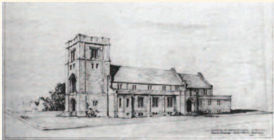
Projet de transformation de l'église Saint-Columba de l'architecte David Shennan, 1952, non réalisé