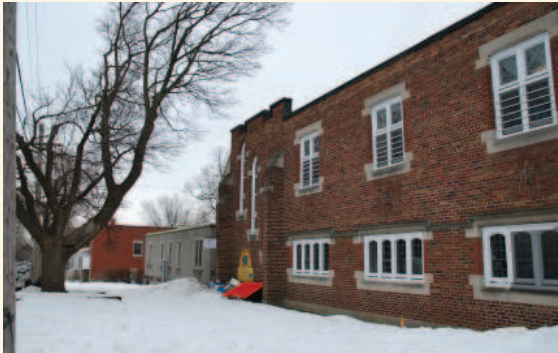
La façade principale du centre communautaire