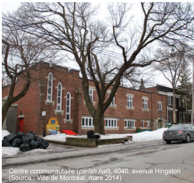
Centre communautaire ( parish hall ), 4040, avenue Hingston