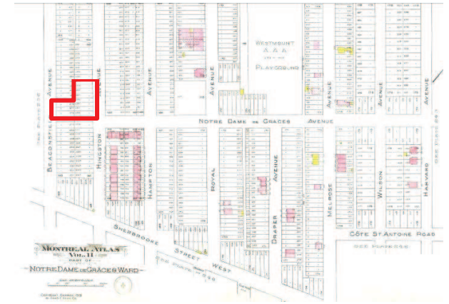
Plan de Goad (extrait), 1913, volume 2, pl.242

Dissolution de la paroisse de Saint-Columba et fermeture de l'église.