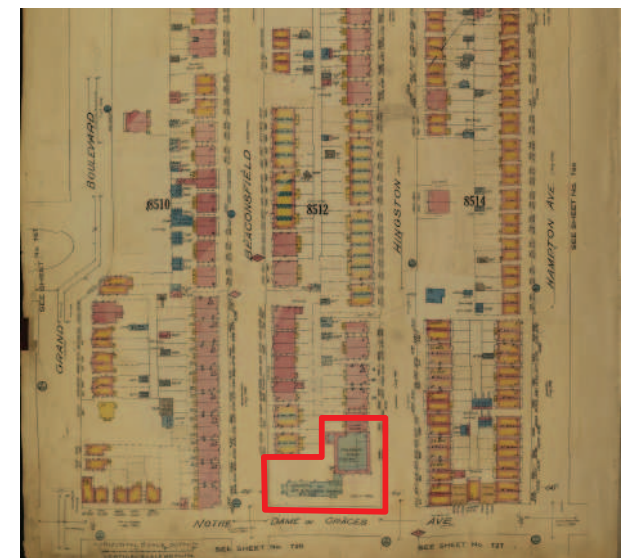
Insurance Plan of Montreal (extrait), 1940, volume VII, pl.768