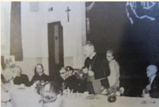
Cardinal Karol Jozef Wojtyla, now Pope John Paul II, addressing (...), 1969

La valeur historique du site de l'église Saint-Columba et de son centre communautaire repose sur :