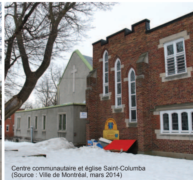
Centre communautaire et église Saint-Columba