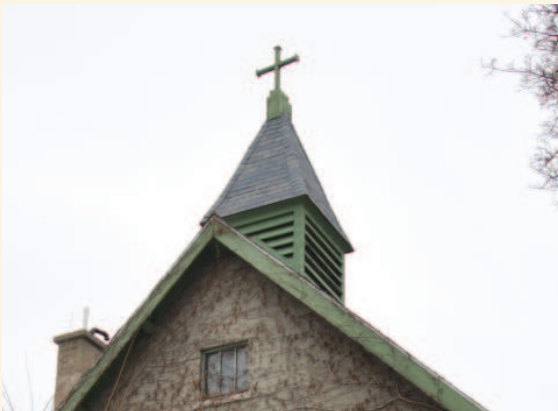
Clocheton de l'église Saint-Columba