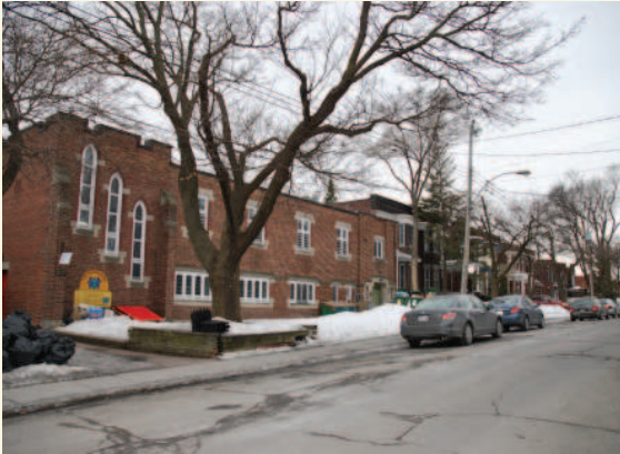
Vue du centre communautaire et de l'avenue Hingston