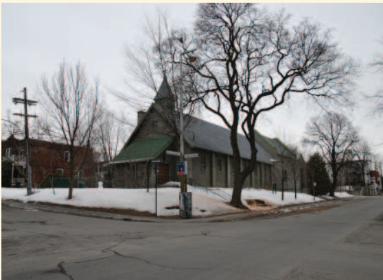
Vue du site depuis l'angle des avenues Beaconsfield et Notre-Dame-de-Grâce

La valeur paysagère du site de l'église Saint-Columba et de son centre communautaire repose sur :