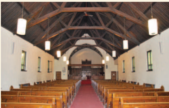
Nef de l'église Saint-Columba

La valeur architecturale du site de l'église Saint-Columba et de son centre communautaire repose sur :