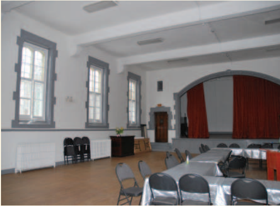
La grande salle du centre communautaire

La valeur sociale et symbolique du site de l'église Saint-Columba et de son centre communautaire repose sur :