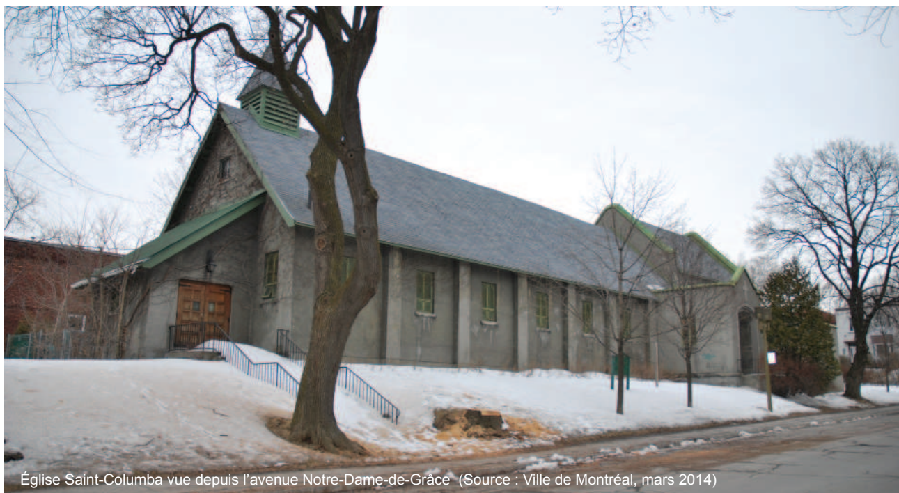
Église Saint-Columba vue depuis l'avenue Notre-Dame-de-Grâce

Enfin, la valeur architecturale de ce lieu repose principalement sur la qualité de la composition néo-Tudor du centre communautaire qui a conservé la plupart de ses caractéristiques d'origine.