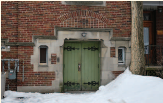
Détail de la façade du centre communautaire